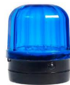
Nød- og redningstjeneste