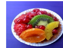
Forsyning av mat og medisiner