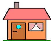
Husly og varme