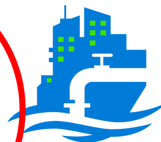
Vann- og avløpsnett