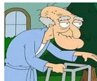
Særlig sårbare grupper