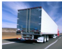
Fremkommelighet for personer og gods