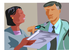
Helse- og omsorgstjenester