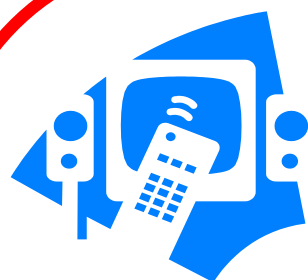
Tele- og datanett