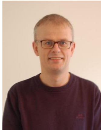
Responsssenteret Øyvind Haarr